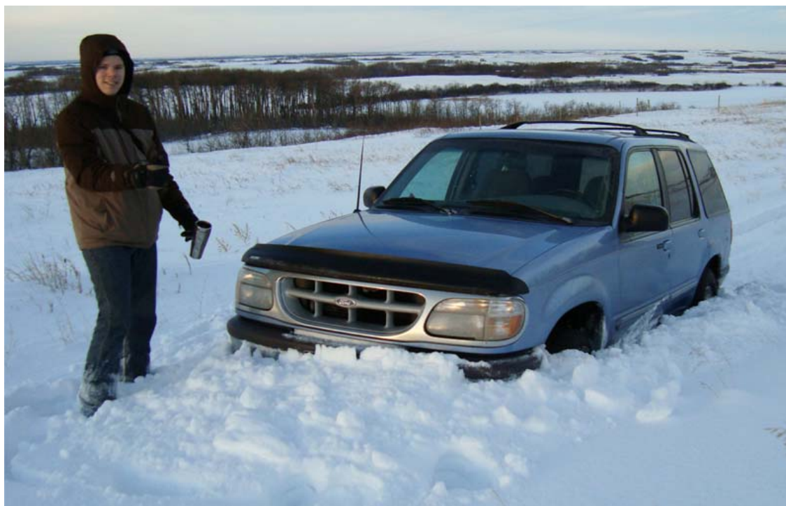
Net iets teveel sneeuw...

Toen we op een zondagochtend de zonsopgang op ons land wilden bekijken hebben we ondervonden hoeveel sneeuw er nodig is om de auto tot stilstand te brengen... Er gaat een redelijke weg naar onze toekomstige yardsite maar door de wind was er een flinke snow bank ontstaan die we niet echt zagen aankomen dus plots zaten we muurvast! Gelukkig hebben we goede cell phone bereik op ons land en de buurman heeft ons met z'n truck en sleeptouw weer op het juiste pad geholpen. Ach ja, wij hebben weer wat geleerd en de buurman heeft weer een leuk verhaal ☺