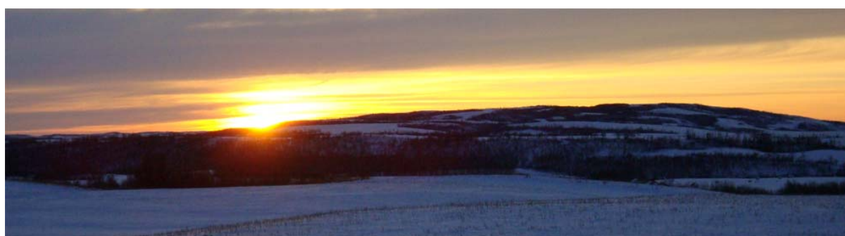
Zonsopgang vanaf ons nieuwe huis gezien, dit mogen we straks iedere dag aanschouwen