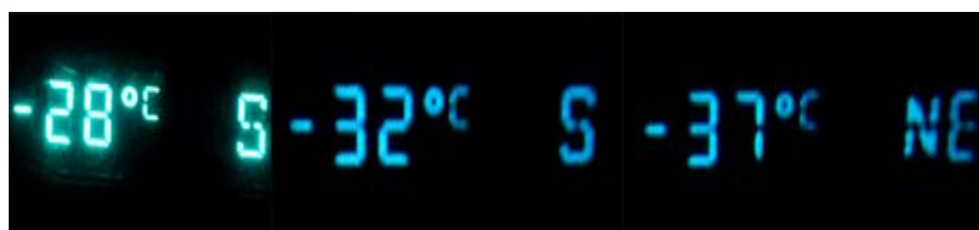
De temperatuurmeter in de auto had er zin in!