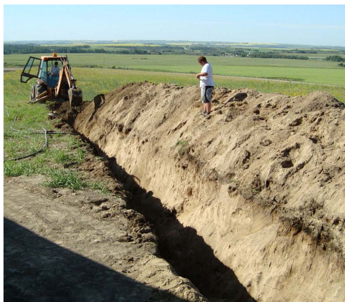
Het ingraven van de waterleiding

Tijdens het graafwerk was Vince de loodgieter aan het helpen met de rough-in plumbing, de riolering van het huis loopt via de basement het huis uit dus ook hier moest het een en ander weer worden ingegraven. We hadden een plan gemaakt waar de badkamer in de basement komt en zelfs de kraan die bij de bar komt moesten we al een definitieve plek geven want zodra de betonnen vloer gestort is kun je het niet meer veranderen!