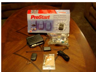
Onze remote starter kit.