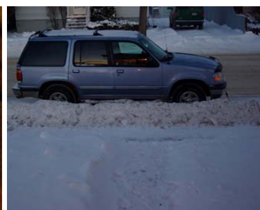
De berg wordt elke dag iets hoger.